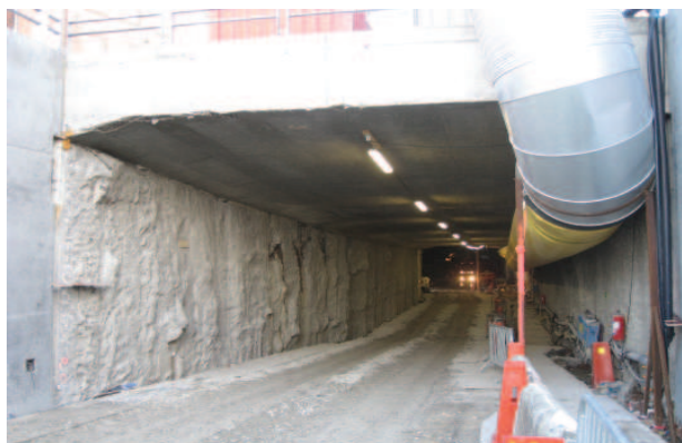
Låååååångt där inne i tunneln syns strålkastarna på schaktbilen som håller på att bli lastad med jordmassor som ska transporteras bort.

Arbetet med att gräva ur det översta lagret, som består av jord, är nästan färdigt. Under ca 3 månader framöver kommer arbetet med att fräsa bort det undre lagret som består av berg, och transportera bort detta.