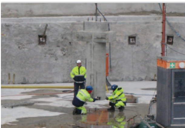
Här lyfts den första pelaren på plats.

Sista veckan i november sattes den första betongpelaren i garaget på plats. Stommen består av prefabricerade pelare och balkar sätts ihop enligt ett noga planerat monteringschema. Man monterar mellan 25-30 st pelare varje dag. Varje garageplan har drygt 90 pelare per plan som bär upp bjälklaget, dvs "taket /golvet" mellan parkeringsplanen. Pelarna är 0,8 m i diameter och är 3,3 m höga.