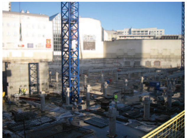
Efter ca 5 arbetsdagar såg arbetsplatsen ut så här - nästan samtliga pelare på p-garagets nedre plan hade satts på plats.

Stommen tillverkas i och levereras från Lettland. Den kommer med båt till Malmö hamn där den lastas om och transporteras på trailers genom stan upp till arbetsområdet. Eftersom arbetsområdet är så litet finns det ingen möjlighet att lagra stommen här på plats, utan leveranserna sker enligt "just-in-time"-principen. Mellan 7-12 st trailers med stomme anländer till arbetsområdet varje dag.