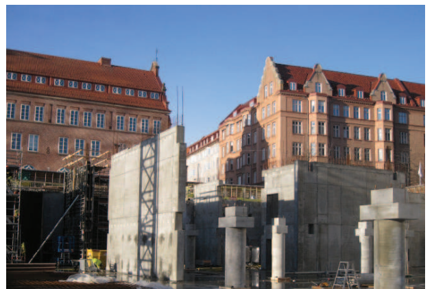
I arbetsområdets nordvästra hörn har vi gjutit väggar till hisschakt där hissarna till höghuset senare ska installeras.

Samtidigt med monteringen av prefabstommen pågår arbetet med att gjuta väggar till hisschakt, teknikrum och trapphus. Det arbetet görs här på plats.