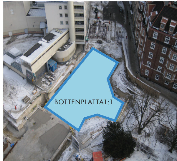
Ca sju meter under gatukorsningen korsningen ligger bottenplatta 1:1 som ska gjas.

En pumpbil kommer att stå i grinden på arbetsområdet och en pumpbil intill det gröna byggplanket. Från pumparna pumpas betong via två stycken armar med långa slangar ner i de brunnshål som har gjorts i gatan för det här ändamålet (de orangefärgade ringarna på bilden nedan till höger). Ungefär 310 kubikmeter betong förs via slangarna genom brunnshålen och ner till manskapet som arbetar med gjutningen därunder.