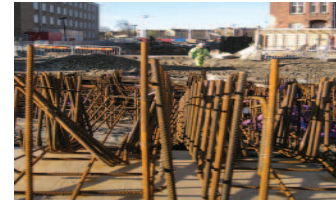
Det går åt flera tusentals ton armering i projektet.

Hack i häl på schakten följer armeringsarbetet. Armeringsjärnen kommer klippta och bockade till arbetsplatsen och najas ihopå (dvs. sätts ihop) på plats i schaktgropen. Bara i parkeringsgaragets bottenplatta är det drygt 1 200 ton armering som ska najas!